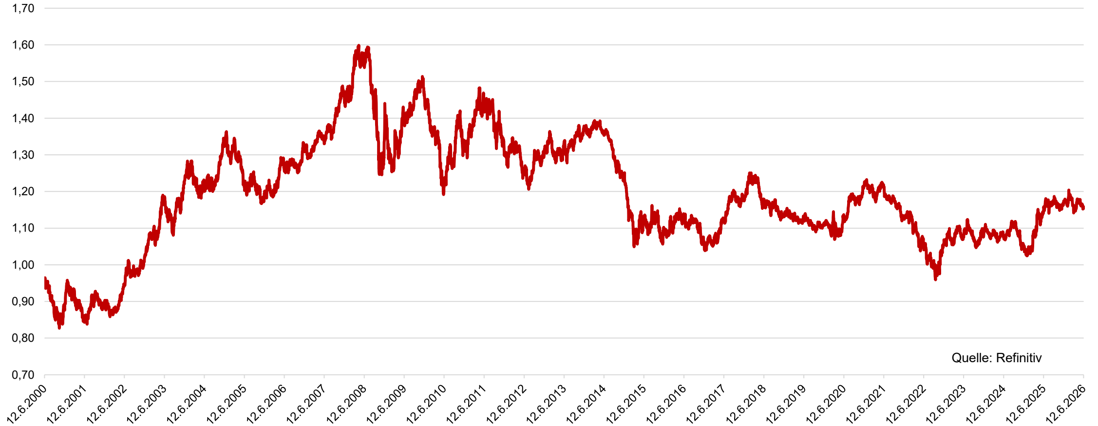
Entwicklung EUR/USD seit 2000